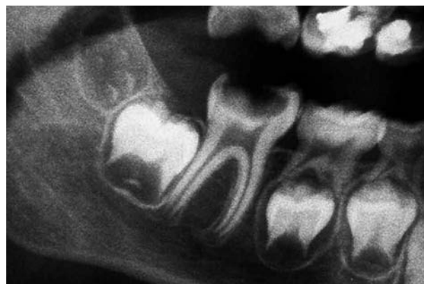
Fig. 2. Segundo molar permanente inferior con inicio de calcificación de furca (Estadio 6-7 de Nolla).

El momento ideal, si se desea obtener el mayor cierre de espacio de forma espontánea, es antes de que haya erupcionado el segundo molar inferior, cuando hay evidencia de calcificación de su furca (Fig. 2). Realizar la exodoncia previa a este estado puede resultar en ectopia del segundo premolar (Fig. 3). Es conveniente valorar la extracción del segundo molar temporal al mismo tiempo si se desea evitar la ectopia del segundo premolar. Para evitar la extrusión del primer molar permanente superior se puede ferulizar o cementar una barra transpalatina. Si la exodoncia de los molares inferiores se