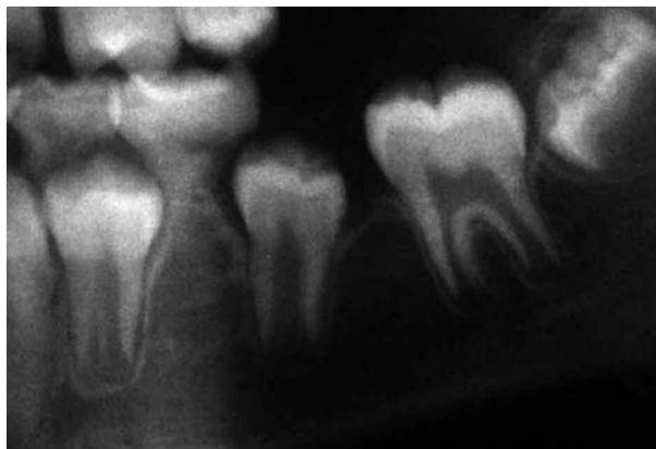
Fig. 3. Ectopia del segundo premolar post exodoncia del primer molar permanente.

the best moment. The decision to extract or not should take into account the other factors previously set out.