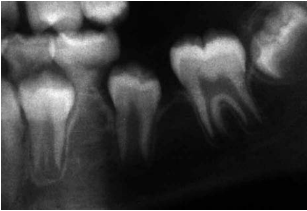
Fig. 3. Ectopia del segundo premolar post exodoncia del primer molar permanente.

hace de forma tardía se acentúa la rotación mesiolingual de los segundos molares permanentes, su mesioversión y el cierre incompleto de los espacios. Puede que para el momento ideal aún no exista evidencia radiográfica de tercer molar. La decisión de extracción será tomada valorando los otros factores anteriormente expuestos.