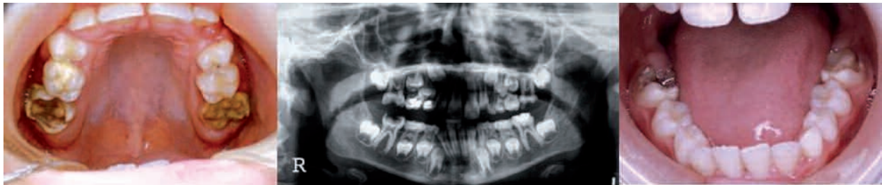
Fig. 1. Case with severe HIM of the four permanent first molars. Extensive crown destruction at an early age.

molars (9). The aim of this study is to propose a treatment sequence for patients with severe MIH of molars, in order to manage the existing malocclusion comprehensively, as it is understood that taking decisions at the right time leads to less complicated orthodontic treatment.