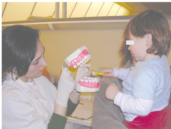
Fig. 1. Instrucción de la técnica de cepillado.

La Academia Americana de Odontopediatría reconoce que para prevenir la caries en niños, se debe identificar a los individuos de alto riesgo en edades tempranas (preferi-