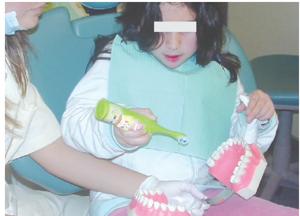
Fig. 4. Instrucción de la técnica de cepillado con cepillo eléctrico.