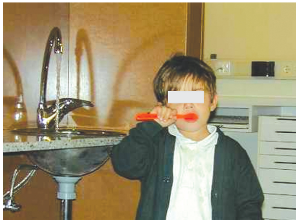
Fig. 3. Niño cepillándose solo. Forma de sostener el cepillo.

En los más pequeños o en niños con problemas de retraso mental o afectación motora (parálisis cerebral, etc.), se producen dificultades con aquellas habilidades que requieren la motricidad fina. Esta circunstancia debe tenerse en cuenta en las prescripciones que requieren el uso del cepillo, la seda, o bien, a la hora de pedir la colaboración del niño para abrir la boca, movimientos de la lengua, los labios, etc. (19) (Fig. 3).