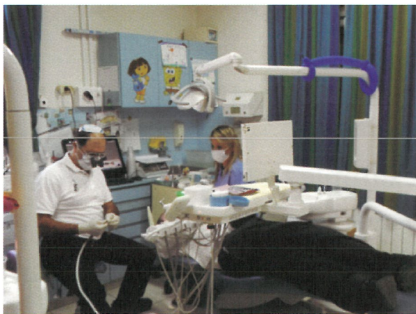
Fig. 2. There are volunteers from all over the world.