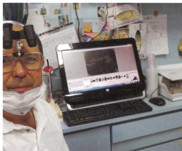
Fig. 3. The clinic has the necessary technology.

careful dental treatment, on disease prevention and on accepting diversity (3).