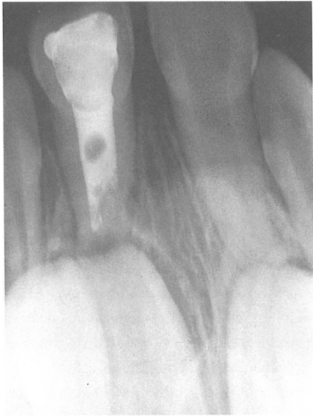
Fig. 3. Radiografía de control a los 6 meses del tratamiento de conductos Ketac-Endo donde no se aprecia ningún cambio en la imagen radiográfica.