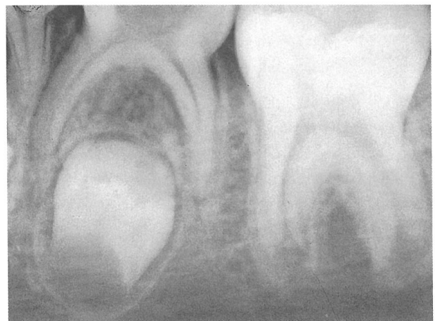
Fig. 6. Segundo molar mandibular con caries profunda.