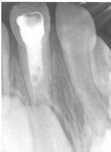
Fig. 2. Tratamiento de conductos Ketac-Endo en incisivo central superior izquierdo. Se observa una burbuja en el espesor del cemento sellador.