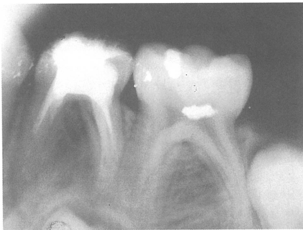
Fig. 4. Tratamiento de conductos y reconstrucción con Ketac-Endo en un primer molar temporal inferior.

Por último presentamos un segundo molar temporal inferior con caries profunda (Fig. 6), en el que realizamos una pulpotomía al formocresol. Como material sellador y en íntimo contacto con la pulpa radicular remanente, se utilizó el Ketac Endo Aplicap, rellenando igualmente toda la cámara pulpar y corona anatómica del molar en la misma sesión (Fig. 7).