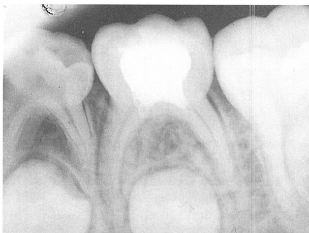
Fig. 7. Pulpotomía y reconstrucción con Ketac-Endo en el segundo molar mandibular.

de este material, en el estudio realizado in vivo con dientes permanentes (17) . Ray, H. y cols. en 1991, observaron que los artefactos visibles a modo de grietas en los cortes de muestras tomadas para estudio con microscopía electrónica, se encontraban en el espesor del sellador, apoyando la hipótesis de que existe unión entre el vidrio ionómero y la superficie de la dentina, los autores concluyen afirmando que este material presenta una buena adaptabilidad y adhesión a la pared dentinaria del conducto radicular. El Ketac-Endo se une químicamente a la dentina del conducto radicular y tal unión confiere una ventaja distinta en terapéutica endodóntica, previniendo la percolación y la penetración bacteriana en la interfase sellador-dentina (1) .