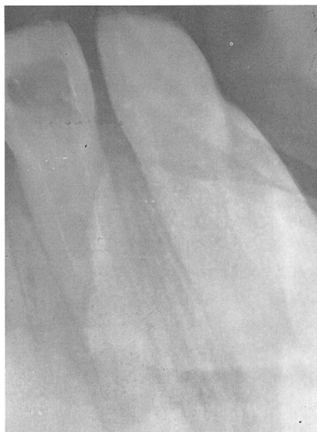
Fig. 1. Incisivo central superior izquierdo con caries palatina profunda.

misma sesión la reconstrucción del molar con este mismo material, ya que la integridad de las superficies vestibular, lingual, mesial y distal del molar lo permitieron. La radiografía de control a los 6 meses del tratamiento revela el buen comportamiento del cemento de vidrio ionómero (Fig. 5); el caso se encuentra asintomático tanto clínica como radiográficamente, por lo que consideramos que ha tenido éxito.