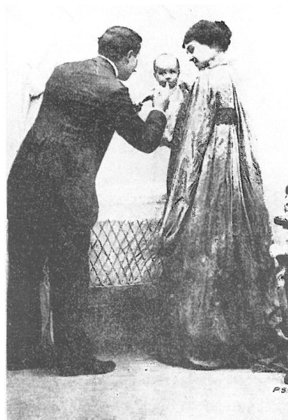
Fig. 3: Del libro "La carte à belles dents" de Yvette et Yvon Israël. Nice. 1987.

ciones del momento, como la revista "La Odontología", podemos pensar en el interés de los profesionales por la odontología infantil, que viene influenciado por las tendencias europeas. Así, el francés Charles Godon en 1911, publica un modelo de ficha dentaria, orientada a la divulgación de la higiene dentaria en las escuelas, sobre un trabajo presentado en el III Congreso Internacional de Higiene Escolar (14) , no como pretendía José León , dando consejos a las madres (Fig. 3), o como había realizado Alfred Bramsen en 1889 que publicó en París "Les dents de nos enfants" (15) , un buen manual sobre la dentición de los niños, sino acudiendo al centro de estudio privado o estatal. Es la etapa de la consolidación de la higiene escolar.