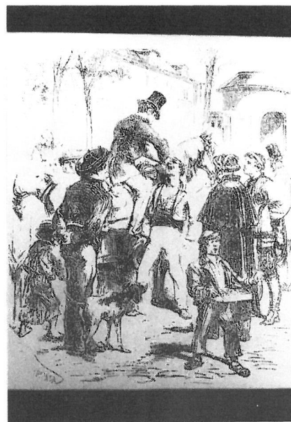
Fig. 1: Del libro "Historia de la Odontología" de Malvin E. Ring. Barcelona 1989.

escolar. En los primeros años, la mayoría de las clínicas municipales se encontraban ubicadas en los propios edificios de las escuelas elementales o secundarias. Además, se pusieron en marcha clínicas móviles para acercar la asistencia dental a la población infantil. El pionero fue Scherer , que trabajaba en Dortmund y transportaba su clínica a caballo (Fig. 1). A partir de 1920 empezaron a utilizarse autobuses, transformados en clínicas dentales, para desplazarse a lugares distantes. En Estocolmo funcionaban clínicas dentales en embarcaciones marítimas, desde los años 40 (3) .